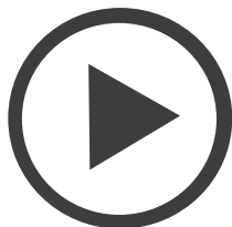
オートプレイ 電源を付けるだけで カンタンスタート