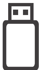
更新 USB を挿すだけで カンタン更新